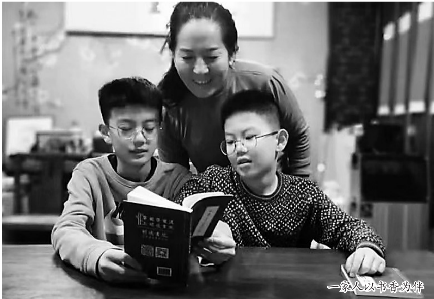
一家人以书香为伴

“‘忠厚传家久，诗书继世长’，这是我们家大门上的对联，也是我们代代相传的家风。中医文化与国学经典密不