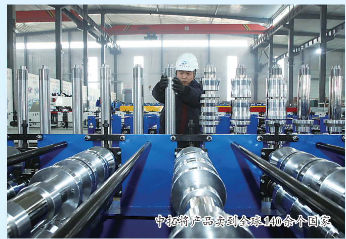
中拓特产品到全球140多个国家

眼下,积极探索外贸宣传模式的开拓,已将直播引流成交的订单占比做到近三成。随着跨境电商渠道的丰富,中拓已经在超过140个国家布局,并开始带动更多沧州企业走向国际市场。