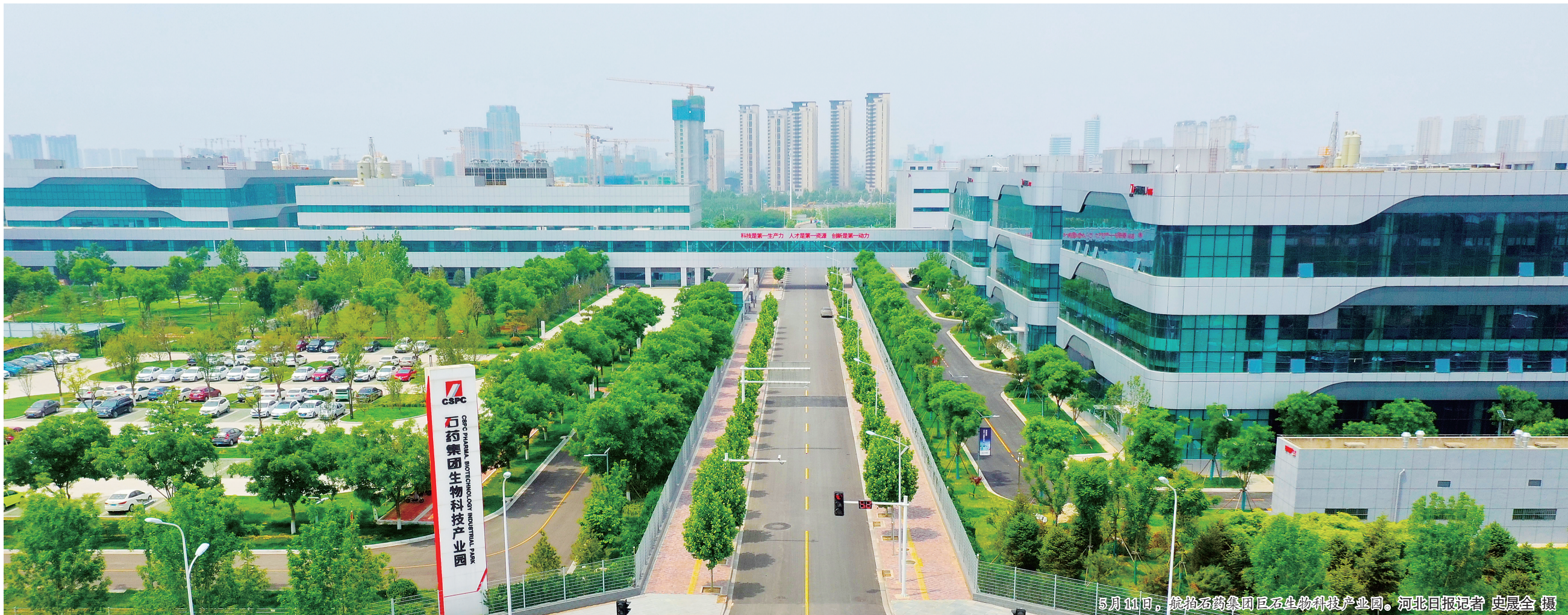
5月11日，航拍石药集团巨石生物科技产业园。