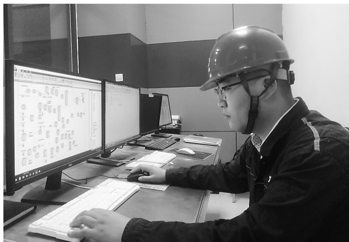
热控专工编写控制程序