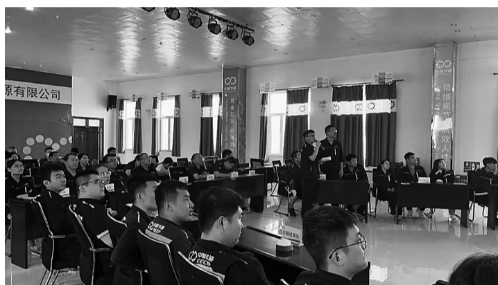
安全生产知识竞赛

大家纷纷表示,要在今后的工作中做到:心中有安全意识、防范意识和应急处置意识,绝不拿生命做赌注,坚决做到安安全全上班,高高兴兴回家,工作中一定要守住安全底线,严格落实“安全生产月”的活动部署要求,积极组织开展相关安全活动,枕戈待旦,时刻保持警觉,清除影响安全的“绊脚石”。将生产和安全融为一体,进行常态化防控,时刻紧绷安全生产这根弦。