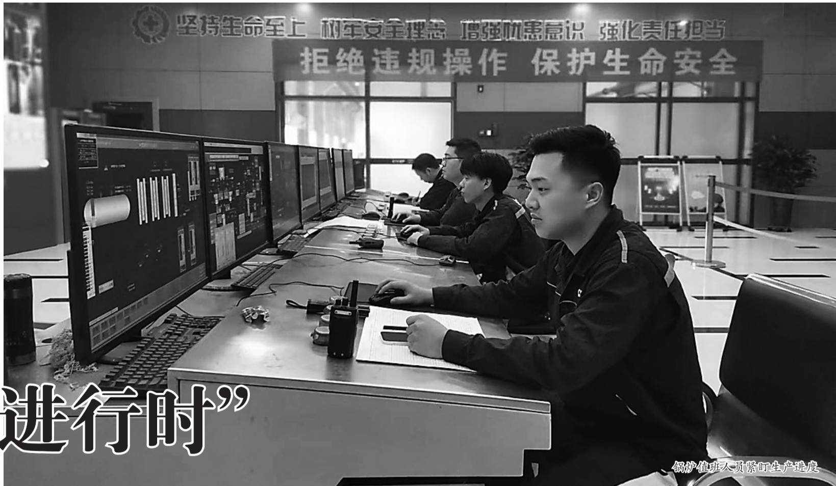
锅炉值班人员紧盯生产进度