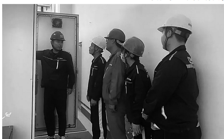
开展餐厨系统停电安全操作培训