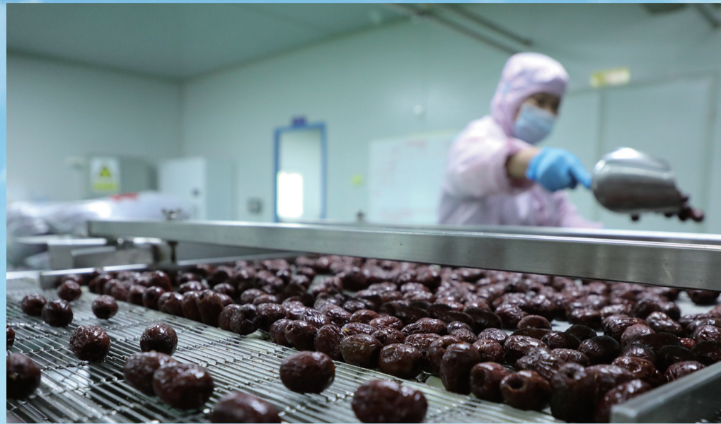
红枣生产加工车间

位于沧县县政府西南30公里的高川乡，与泊头、献县交界，有着“一川连三县”之称。近年来，这个乡依托自身区位优势，持续开展“党建+特色产业”，带动现代农业做大做强，走出一条产业兴旺、生态宜居、乡风文明、治理有效、生活富裕的乡村振兴之路，为助力全市高质量发展贡献自身的力量。