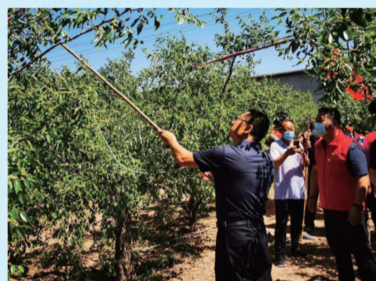
志愿服务队正在开展助农活动