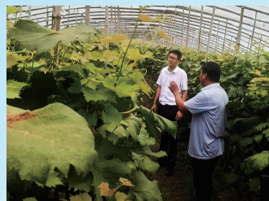
特色种植瓜果大棚

生活环境。同时，在“三夏”工作中，重点做好农机调配、维修服务、机械燃油保供、火灾预防等工作，帮助农民解决在小麦抢收过程中遇到的问题，确保高川乡小麦“颗粒归仓”。高川乡党委还强化村干部坐班、“三会一课”“多彩主题党日”等制度。深入落实干部质量提升工程，制定了《高川乡村干部培训计划》和《高川乡村干部培训方案》，采取现场教学+线上学习+外出参观学习等方式，今年对村干部进行专题培训8次，内容涉及党史教育、村干部能力提升等。建立“1+10”党员联系户制度，每名网格党员沟通联系网格内的10户群众，每月至少走访一遍，倾听民意，帮助解决实际困难。