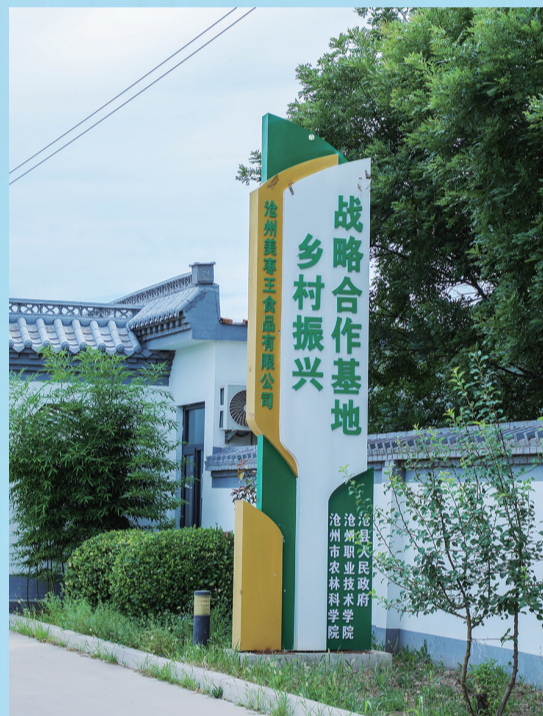
“美枣王”成为当地乡村振兴战略合作基地