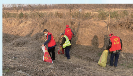
党员志愿者正在清理垃圾

理到收获，需要用工约3000人次，很多年纪稍大的村民，不用出村，就能挣到每天约200元工资。从无到有，高川乡带领农民走出了一条新致富之路，共有14个村因土地流转，增加了村集体收入，年收入共100多万元。截至目前，全乡共有专业合作社72家，其中县级合作社3家，共建有果蔬大棚80个，种植面积500余亩；西卢、王码头、高福屯等村流转1500亩土地种植中药材；后村、儒林藻等村流转土地或者订单种植苗木1.5万亩，合作社与外界达成合作协议，稳定销售渠道，达到稳定增收。今年以来，高川乡共流转土地约8千亩，均用于种植粮食作物。累计流转土地16000多亩，其中约14000亩用于种植玉米、小麦、高粱等。