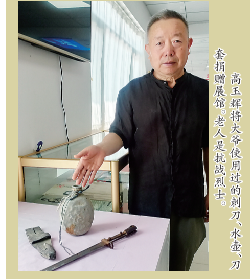
高玉辉将军使用过的刺刀、水壶、刀套捐赠展馆。老人是抗战烈士。