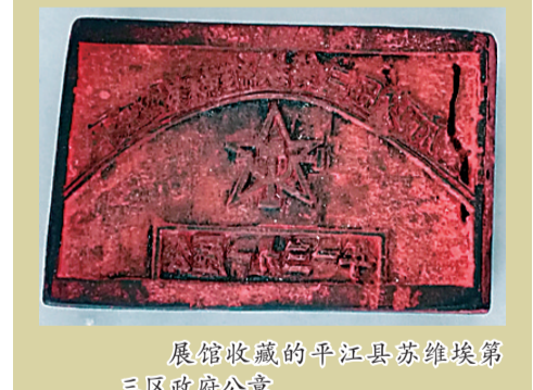
展馆收藏的平江县苏维埃第三区政府公章