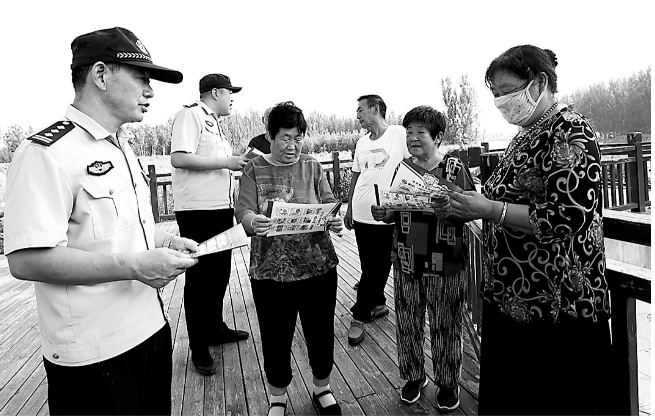
日前,东光县南霞口派出所民警深入大运河沿线,开展反诈和防溺水宣讲活动,为辖区群众讲解各类典型案例,让人民群众提高辨识各类诈骗和防溺水的能力,增强自我防范意识。

本报讯(记者胡学敏)时下,正是秋粮作物生长旺盛期,在吴桥县单家店村大豆玉米带状复合种植示范点,放眼望去,大豆玉米整体长势喜人,农户正忙着除草、杀虫等管护工作。“通过密植玉米,发挥边行优势,提高产量。同时,种植大豆,实现在玉米基本不减产的情况下多收一季大豆,效益可观。”村民宋洪卫表示,他家从去年开始采用大豆玉米带状复合种植模式并取得良好效益,带动周边农户竞相学习参照种植。 大豆玉米复合种植是稳定粮食生产、增加油料产量的有效种植模式。记者从市农业农村局获悉,在确保粮食安全的前提下,今年我市共推广大豆玉米带状复合种植21.4万亩,较去年增加6.9万亩。采用这种复合种植模式,可让农户实现“一地双收”。 据悉,今年我市在玉米产区大力推广大豆玉米带状复合种植,主要依托家庭农场、农业合作社和种植大户等新型经营主体展开。为推进大豆玉米带状复合种植模式,全市各级农业农村部门做细做实补贴政策、技术培训、品种筛选、农机农资、病虫害防治等工作,在稳定大豆净作面积前提下,落实好补贴政策,保障完成种植任务。 夏播前,沧州市农广校在青县盘古镇曹辛庄村组织开展了高素质农民大豆玉米带状复合种植技术现场观摩培训活动。参训人员现场观摩了种植、施肥以及植保相关的各式农机具,专业农机手进行了实操演练,技术专家现场给农户传授指导技术,及时解决他们在种植管理技术上遇到的难题。夏播过程中,农技人员走进田间地头,现场指导农民带状复合种植技术。夏播完成后,市级农业专家团队包联各种植区,协调解决大豆玉米生长过程中存在的困难和问题。 结合资源禀赋、品种特点、配套机具和生产水平,我市因地制宜确定了大豆玉米株行比,重点推广4:2模式,即实行4行大豆带与2行玉米带复合种植,充分发挥边行通风、透光优势,努力做到“玉米基本不减产,多收一季大豆”的目标。 “下一步,我们将努力抓好大豆玉米带状复合种植的田间管理工作,推动大豆玉米带状复合种植取得良好效益。”市农业农村局种植业科相关负责人说。