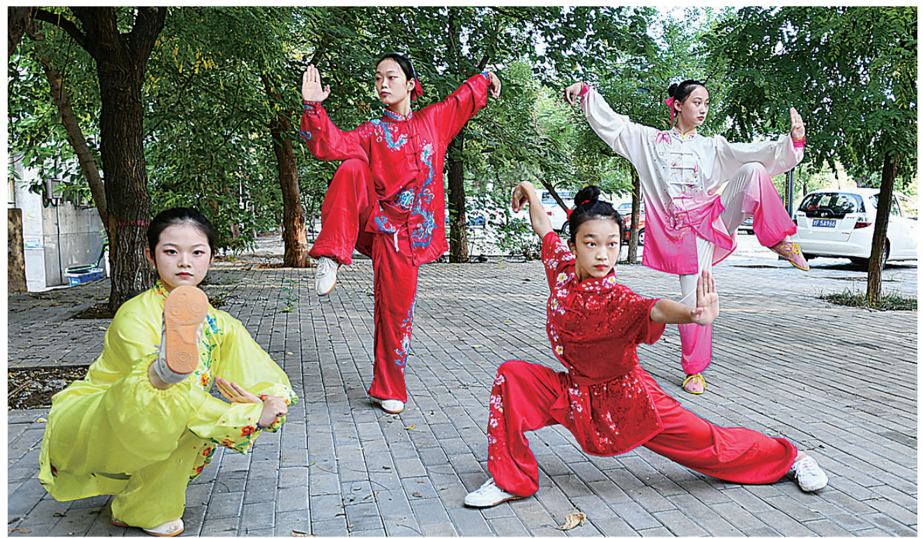
运河边有不少槐树，槐树林正好围成个练武场。孩子们年龄各异，一招一式已颇具功夫。

建华街往北，还是这条街，依次名为麻姑寺、小街子、盐场。一条街四个名字，因此也叫四合街。这条老街，南头儿新华桥边住着温家，北头儿永济桥边住着赵家。两家都是武术世家。赵家的赵寿山，与温家的温仲石，还都曾担任沧州市政协副主席。在四合社区工作人员的带领下，我们来到巷子最北头儿。家家户户的门牌显示，这里已是盐场街。所谓盐场，指的是长芦盐场，其历史上溯到元明清。那时，运河漕运繁盛，长芦都转运盐使司就设在沧州运河畔。盐场的兴盛，直接为沧州带来了经济的繁荣。清代，满族武将派驻盐场，他们在这里繁衍生息，与本土武者不断切磋、交流、融合，沧州武术一改民间江湖特色，呈现出更重实战的新气象。一处寻常院落，社区工作人员说，这就是赵寿山的老宅，他的孙子赵德新在不远处开有中医馆。每天清晨，他都会去运河边的老槐树下练武。行医习武，在他们家已传承了五代。赵家有两个人名列《沧州武术志》，分别是赵明茂与赵寿山。“赵明茂（1846-1935），满族，沧州盐场街人。师承陈善习燕青拳。因天资聪颖，练功刻苦，深为陈善垂青。他手脚快，精擒拿，善用腿。他使腿时，拳脚齐发，一腿连三招，使对方防不胜防。他的鸳鸯腿，出腿疾速，命中率极高，有‘赛活猴’之称。”“他从不欺弱惧强。清光绪22年（1896年）7月15日放河灯，人多拥挤。一个维持秩序的士兵被挤倒，众士兵人手一棒，乱打游人。赵忍无可忍，在一士兵持棒向他打来时，夺棒还击，把20多名士兵打得四处逃窜。赵在沧授徒百余人。”“赵寿山，1907年生。自幼随祖父赵明茂练武，18岁又拜刘俊岭为师，习燕青拳。他腿功深厚，除练一般的里合、外摆、正踢、侧踢外，还练插花腿、偏腿、趟连、套环、麻叉、十字、鸳鸯、大翻车等多种腿法。而每一腿法，又都各有基本功，尤精靠打十八勾。授徒50年，达300多人。”“1959年，天津市举行12县民间体育比赛，他表演大师鞭和燕青拳，获一等奖。1962年任沧州市武术研究室副主任。”“赵寿山武艺较深，且精骨伤科，对舒筋、活血、正骨、按摩有较深造诣。多年来，他一面授徒传艺，一面行医义诊，让许多患者恢复健康，受众人赞誉。”