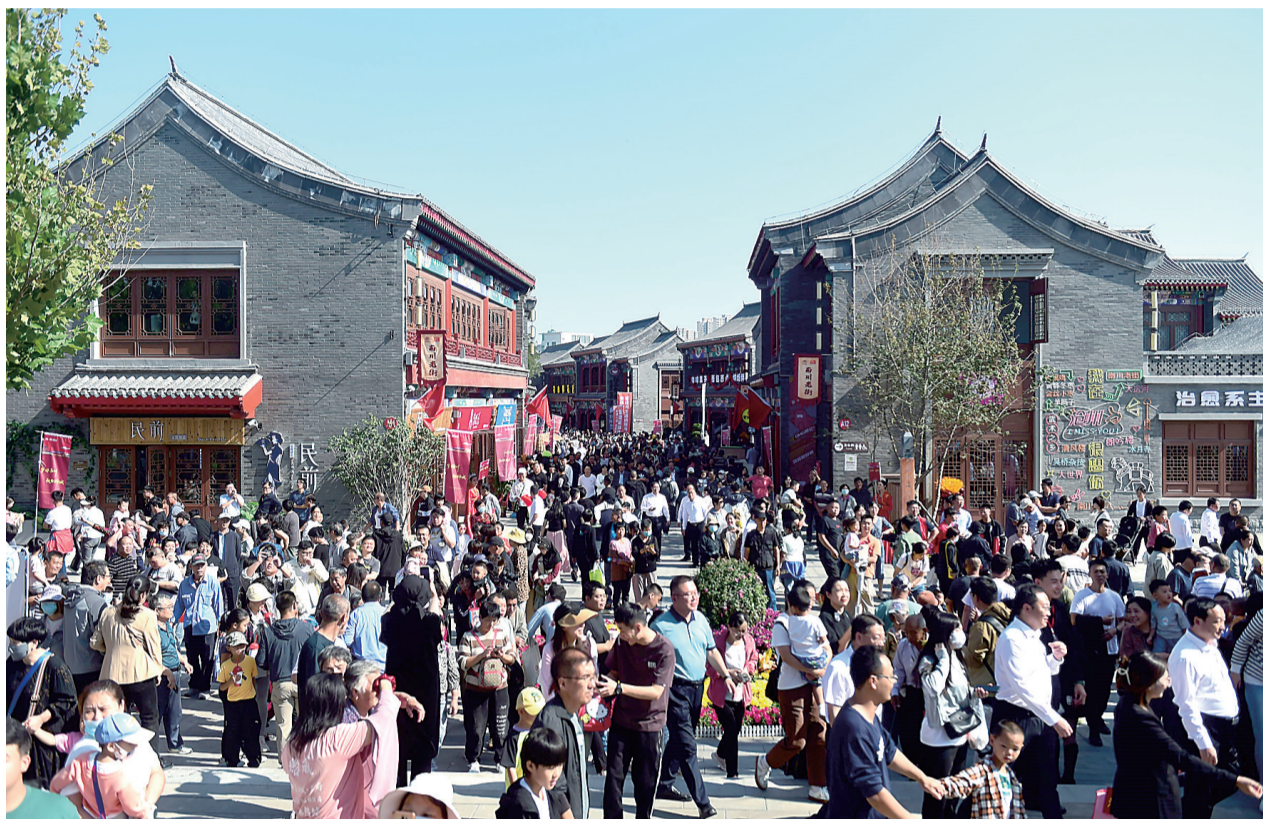
10月1日，南川老街盛大开街，吸引了众多游客前来游玩。

来到南川老街，一定不要错过各类充满沧州特色的文创产品。在狮城印象小店，进出的顾客络绎不绝，墙壁上“517（沧州建于公元517年）”“953（铁狮子铸造于公元953年）”“216（京杭大运河沧州段长216公里）”三个数字十分醒目，向人们讲