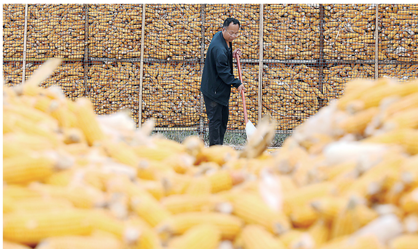
近日，新华区小赵庄乡孙庄子村农民在整理收获的玉米。金秋时节，各地农民抢抓农时全力收获，田间地头处处是忙碌的秋收景象。

据了解，河北医科大学第一医院先心病公益团队自2004年开展活动以来，已累计免费为43万名儿童进行了心脏健康检查，成功救治患儿1.4万余名。