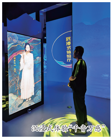
沉浸式体验“千奇万感”

20米长的L形LED大屏幕共分上下两块。上屏，运河流经城市的地方代表性建筑和非遗技艺，从北向南缓缓而来，北京天桥、天津古文化街、沧州沧曲书舍、扬州瘦西湖……下屏则是电子地图，城市地名“镶嵌”在滚滚运河水中，与相应的城市风情上下对应。35个城市的运河风貌与非遗文化，通过国画风格的手绘图展现出来，在数字媒体技术的支持下，整幅长卷动了起来，犹如流动版的“清明上河图”。