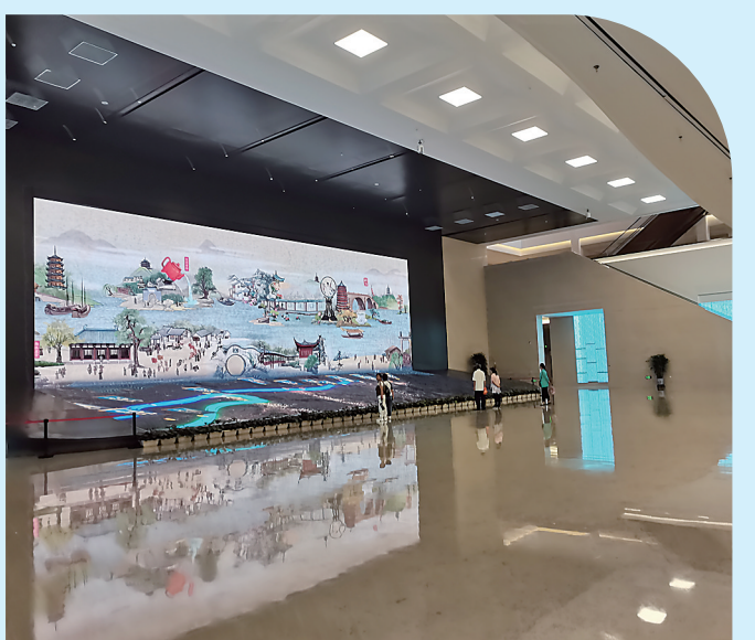
数字加持，“长卷”动起来