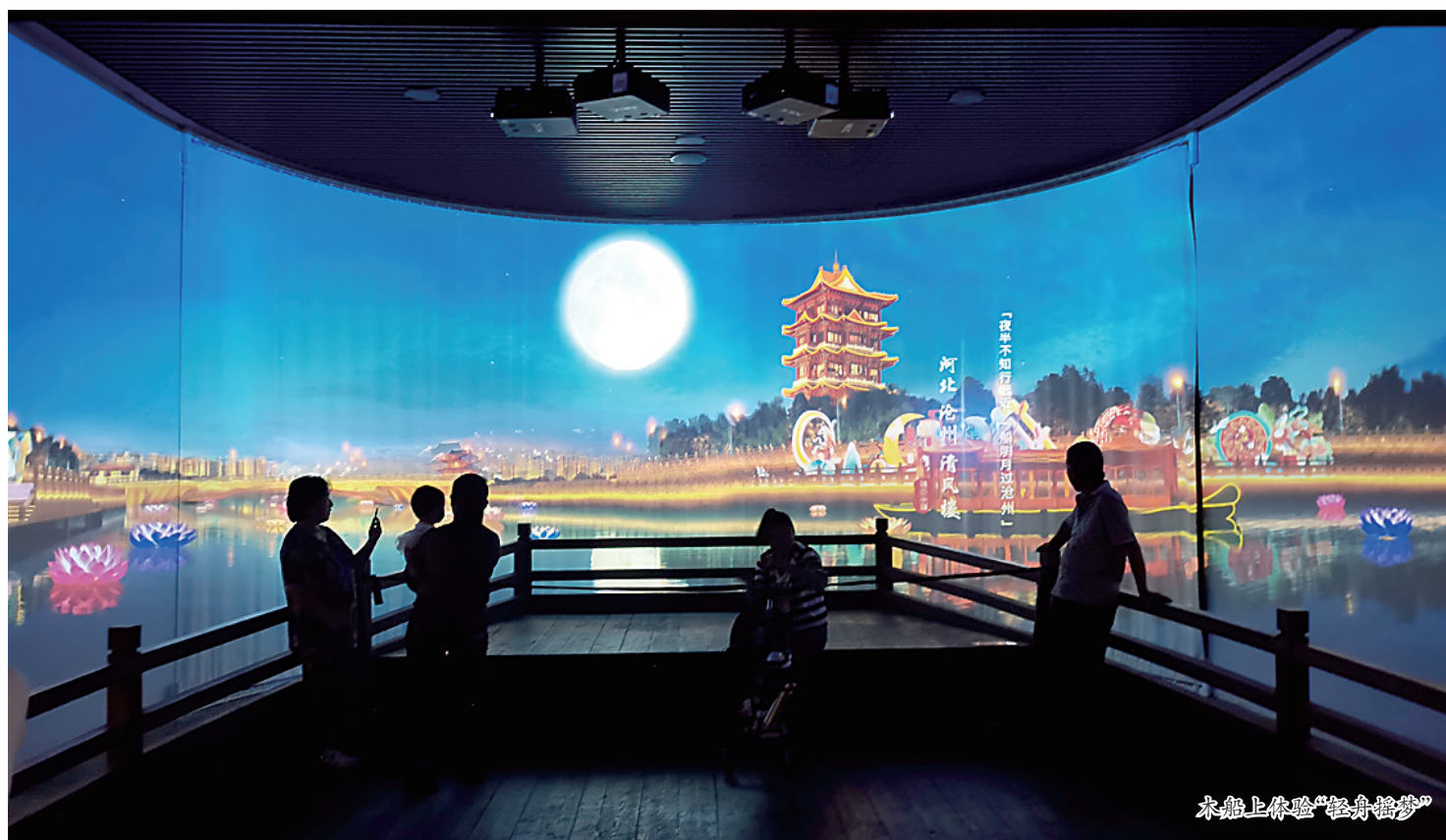
木船上体验“轻舟摇梦”

运河流经城市景观以国画的形式动起来，站在船上可沉浸式体验运河风情从身边掠过，在多画面智能融合的空间里体验非遗文化，扫码即可享受AI换脸，触发雷达装置可听古人奏乐……国庆小长假，中国大运河非物质文化遗产展示馆游客爆满，人们在欣赏非遗文化的同时，也在数字化、智能化营造的“声光电”世界中，感受了一把科技的力量。