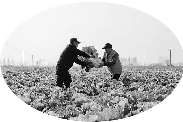
眼下，东光县大明寺镇的大白菜进入采收期，田野一片繁忙景象。

近年来，大明寺镇积极拓宽群众致富增收渠道，大力发展适合本地的特色种植产业。为保证大白菜满足市场需求，大明寺镇党员干部成立了志愿服务队，积极帮助菜农及时采收。