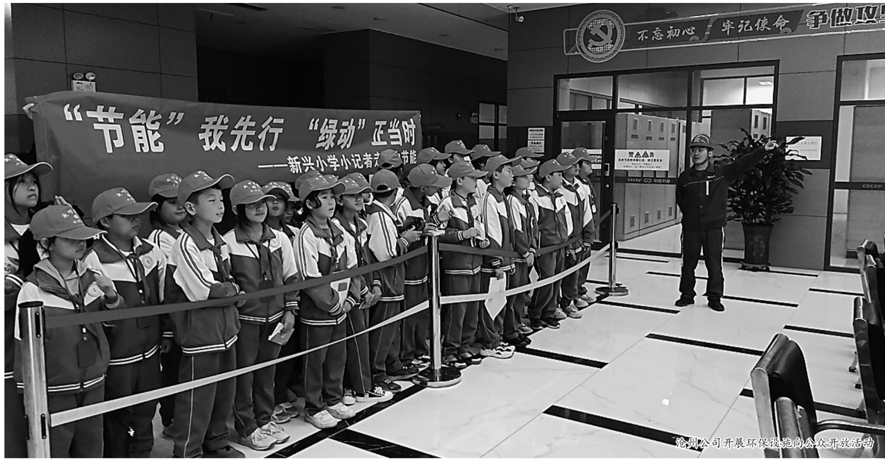
沧州公司开展环保设施向公众开放活动

学思想、强党性、重实践、建新功。近来,中节能沧州公司深入开展学习贯彻习近平新时代中国特色社会主义思想主题教育,进一步增强党员干部干事创业的决心和信心,指导公司垃圾发电、安全生产等各项工作。在此基础上,公司做实做细知识培训、隐患排查、生产调度等工作,未雨绸缪规划工作,发现堵点解决痛点,为公司进一步提升效益夯实基础。