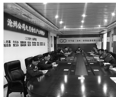
召开生产大调度会

对标缺口、深挖原因,创新思路、强化措施;要在强执行、抓落实上下功夫,深入总结分析当前经营情况,统筹协调、铆足干劲、细化措施,想方设法解决“难点”、全力以赴打通“堵点”,既要确保全年目标任务顺利完成,又要积极谋划下一年生产经营各项工作,高质量完成今年各项任务,实现明年工作良好开局。