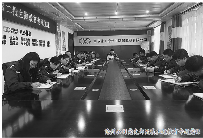
沧州公司党总支书记讲授主题教育专题党课

通过参加此次专题党课,党员纷纷表示,将进一步把主题教育学习转化为日常工作的动力,端正态度、提高思想觉悟、主动担当作为,不断提高履职尽责的能力和水平,为公司高质量发展贡献自己的力量。