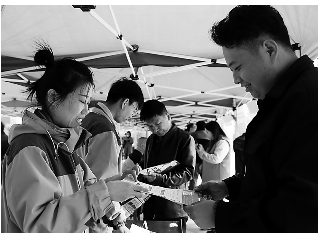
日前,孟村回族自治县举行招聘会,面向高校毕业生、待业失业退役军人、农民工等群体。其间,共组织优质企业70余家参加,提供岗位1000余个,涉及管道装备技术、畜牧业专技、教育、建筑、金融、服务等行业。

本报讯(记者李智力 通讯员孔庆凯)日前,省文化和旅游厅印发了《关于公布第三批河北省乡村旅游重点镇和第五批河北省乡村旅游重点村名单的通知》,献县垒头乡沈于村入选第五批省乡村旅游重点村名录。截至目前,我市省级及以上乡村旅游重点村增至14个。 据了解,为进一步推动乡村旅游高质量发展,省文化和旅游厅于2019年启动了乡村旅游重点镇和第五批河北省乡村旅游重点村名录建设工作。乡村旅游重点镇评定工作是以重点镇为牵引,立足区位优势和资源禀赋,以点带面打造全域旅游,全力推进文旅赋能乡村振兴、农文