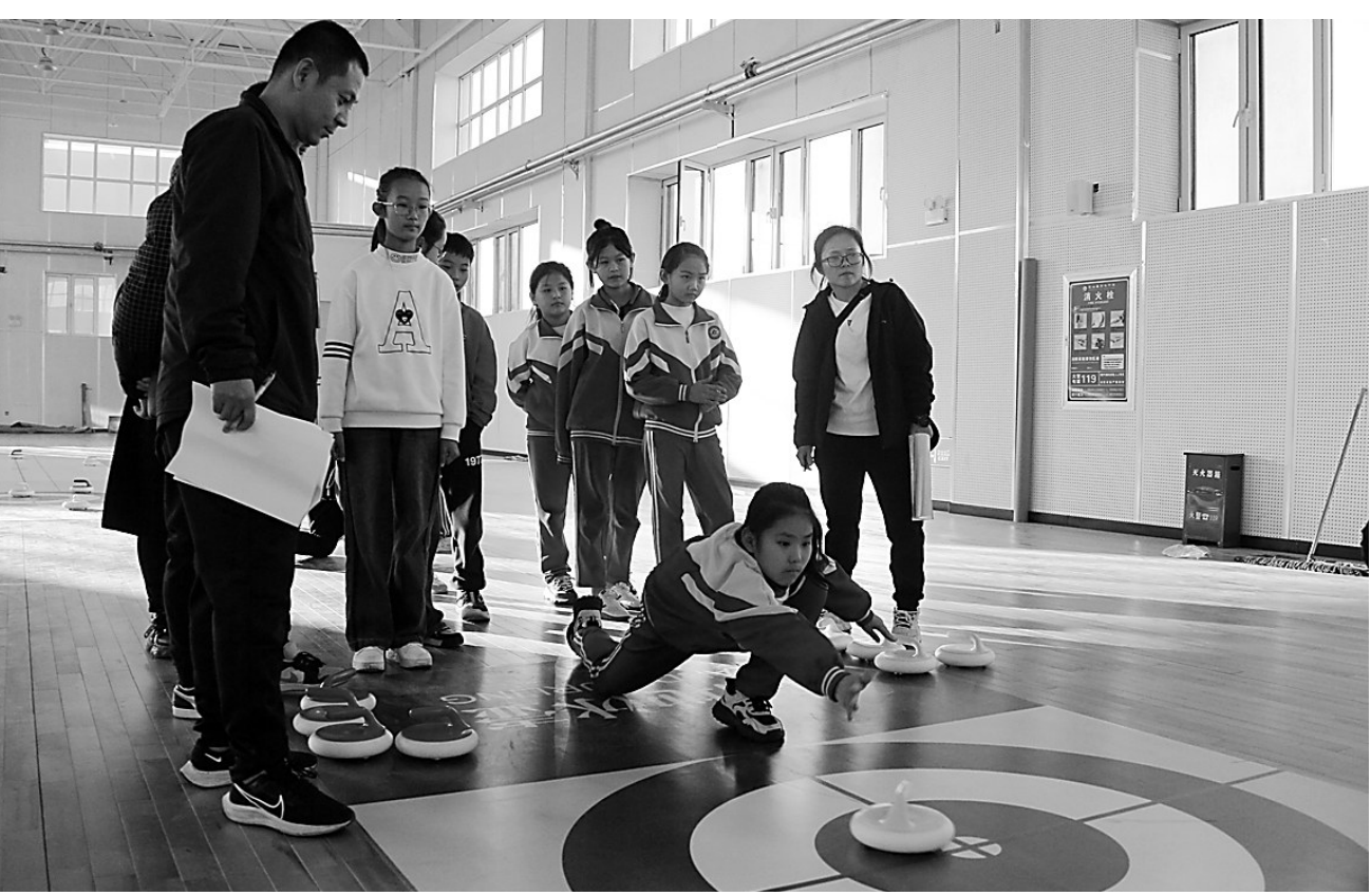
近日,盐山县举办第五届冰雪运动会陆地冰壶单项赛。比赛让同学们“沉浸式”体验到冰壶运动的魅力与乐趣,激发了师生的运动热情。