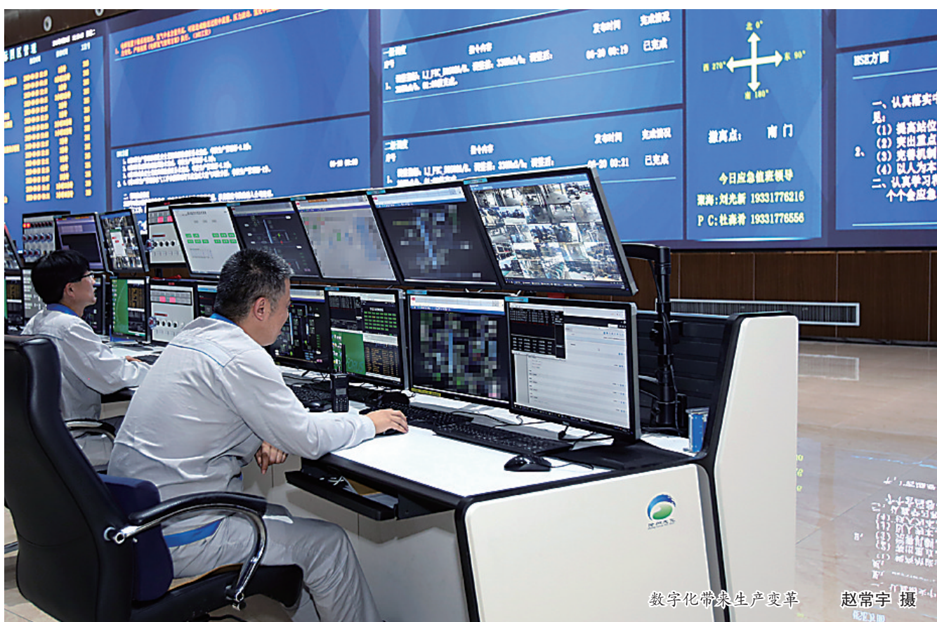
数字化带来生产变革

近年来，我市不断推动产业技术变革和优化升级，有效突破产业瓶颈，牢牢把握创新发展主动权，加快推进数字经济、智能制造、生命健康等战略性新兴产业发展，努力形成更多新的增长点、增长极，以科技创新为引领，抢占未来发展新高地。