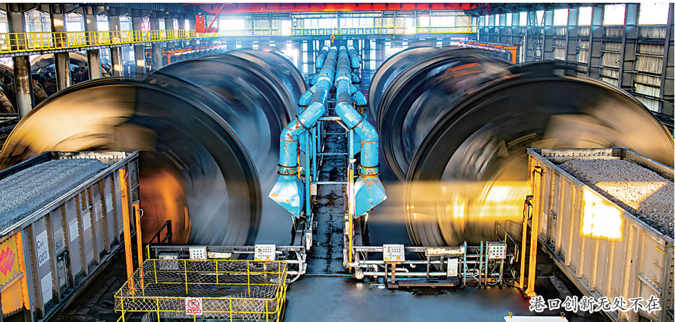
港口创新无处不在