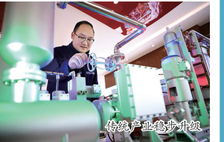
传统产业稳步升级

使用建筑垃圾再生利用技术，将建筑垃圾变废为宝，将原路面结构中的石灰土底基层变更为水泥稳定再生砖石；将旧路面上的沥青提取分离，再加入以废食用油为原料研发的再生剂，“再制造”的沥青性能更加稳定；将建筑垃圾再生骨料粉磨到粒径小于0.075mm的微细粉末，作为矿物掺和料代替粉煤灰生产再生微粉混凝土，也可作为环保型土体稳定剂的一种组分，代替水泥、石灰等传统材料；将“核磁共振”技术引用到工程检测领域，综合运用互联网、云计算等技术创建“智慧工地”；采用泡沫沥青温拌技术，