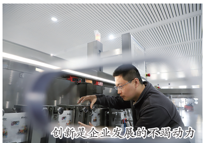
创新是企业发展的不竭动力