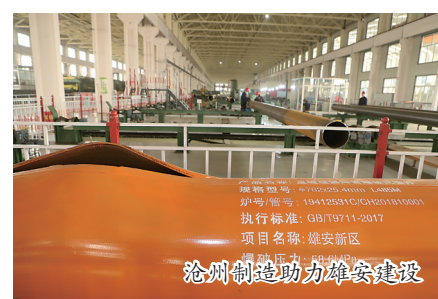
沧州制造助力雄安新区建设

把时间抢回来，把发展动力重新释放，把市场活力激活……2023年，忙着“抢”回订单的外贸企业，稳住了供应链。