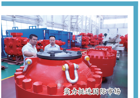
实力挺进国际市场