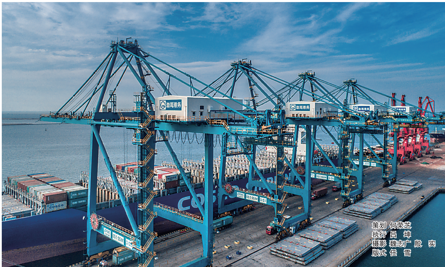
策划 何荣芝 执行 吕坤 版式 任雷