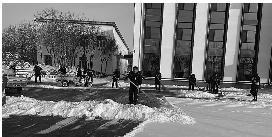
扫除积雪保安全畅通

大家努力奋战,终于开辟出了一条“平安路”“温暖路”,有效保障了路面畅通和公司员工的出行安全,每个人的脸上都洋溢着开心的笑容。