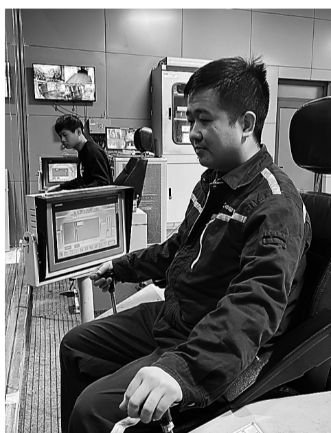
冬季行车安全培训

12月19日,中国环保集团党委主题教育领导小组来到沧州公司,召开沧州地区项目公司主题教育座谈会。中国环保集团党委、主题教育领导小组副组长、总会计师邓先柏出席会议并讲话。