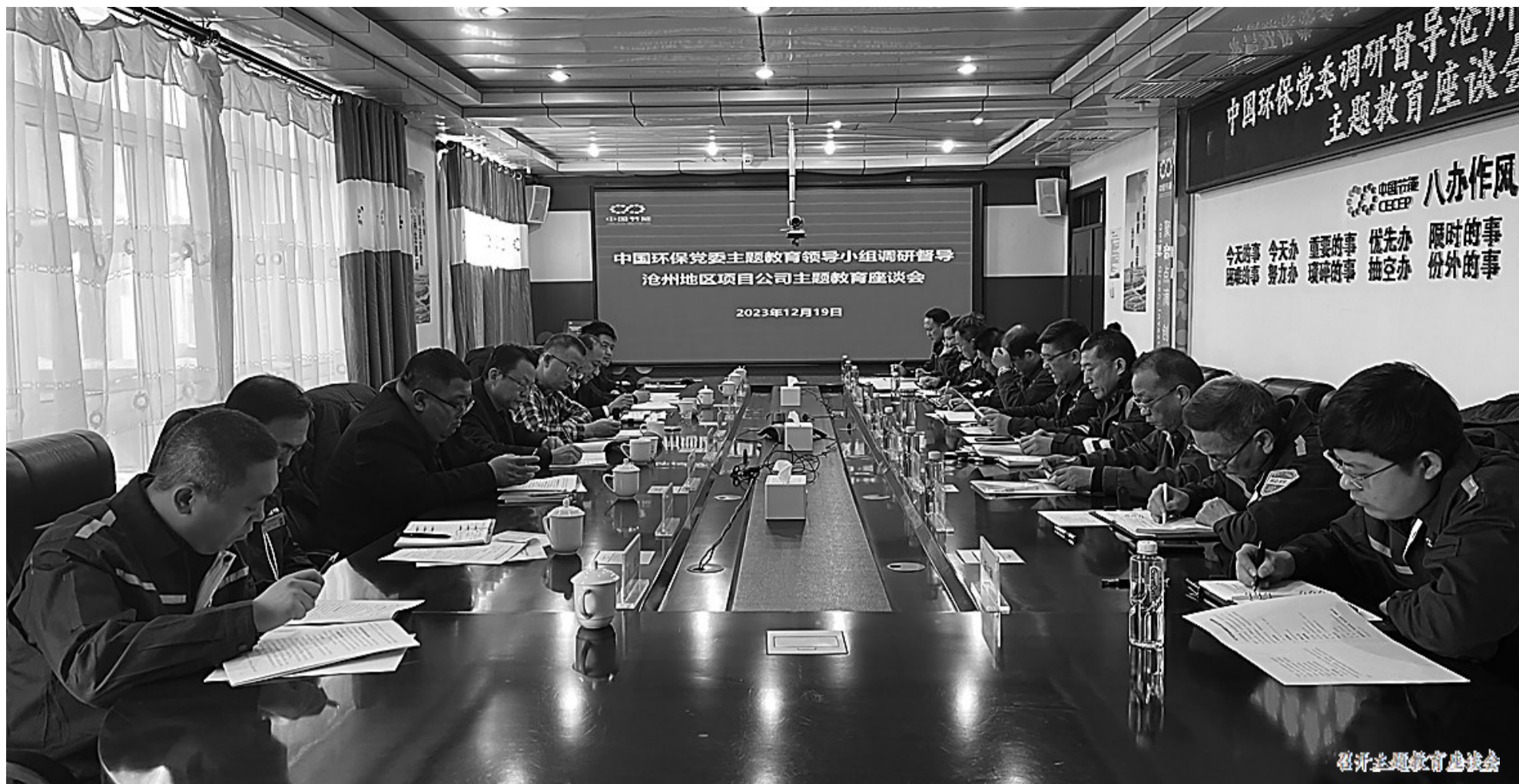
召开主题教育座谈会

聚焦主责主业,中节能沧州公司将主题教育和实际工作相结合,努力做到学思用贯通、知信行统一。坚持将经济效益和社会效益相统一,做到生产安全两手抓,一年来,公司生产稳定运行,年可发电2.3亿度,节约标煤12万吨;环保绩效创A取得突破性进展,经历了极端天气的考验,各项指标稳中有进,为明年的工作打下坚实基础。