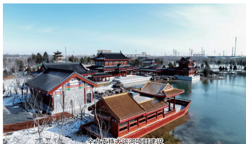
全力支持大运河项目建设