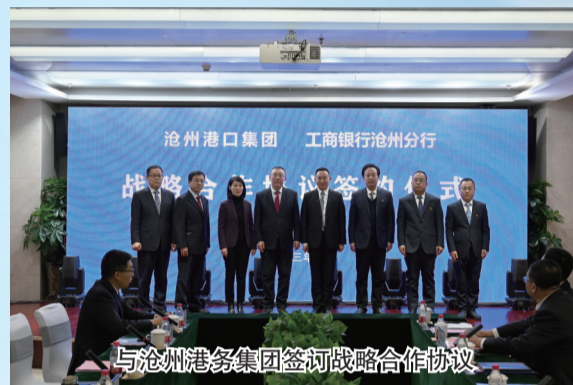
与沧州港务集团签订战略合作协议

协议,优先支持黄骅港后续建设,有效推动重大项目落地。2023年,累计向全市重点领域、重点项目、重点企业投放566亿元,向渤海新区黄骅市区域投放贷款145亿元。积极走访市农业农村局、农业龙头、种植大户等,支持旱碱麦相关产业链共计32户,金额4800万元。