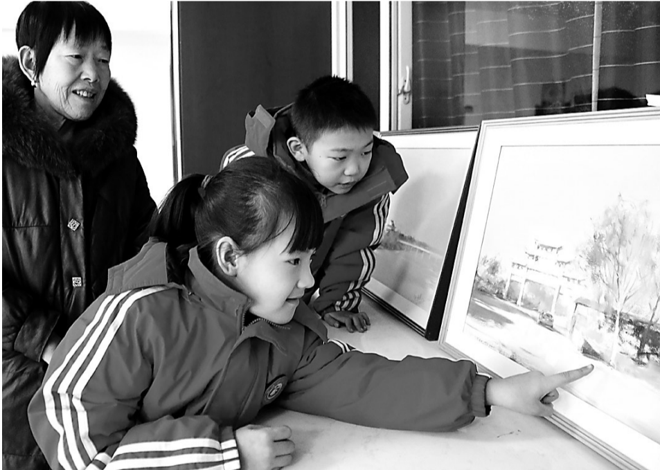
日前,盐山县韩桥村在党群服务中心举办画展活动。这次画展以“和美乡村”为主题,展出了多幅优秀画作,充分展现韩桥村乡村振兴成果。

服务水平,精心办好社会事业,围绕全生命周期重点抓好保障,切实保护群众合法权益。 坚定不移推进生态文明建设,打好污染防治攻坚战、生态修复主动战和节能降碳总体战,加快构建绿色生产生活方式。强化底线思维,有效防范化解重大风险,提升基层防灾减灾和自救互救能力。加强党的全面领导,强化目标导向,提高工作本领,坚持系统观念,树立创新思维,解放思想求突破,凝心聚力谋发展,扎实推动市委对经济工作的部署要求落地见效。