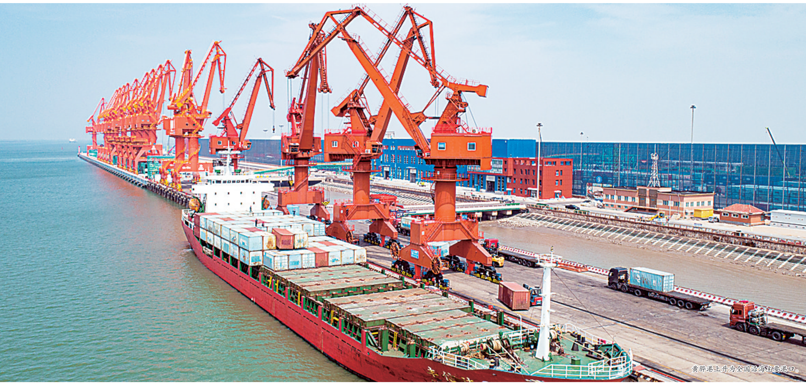
黄骅港上升为全国沿海主要港口。