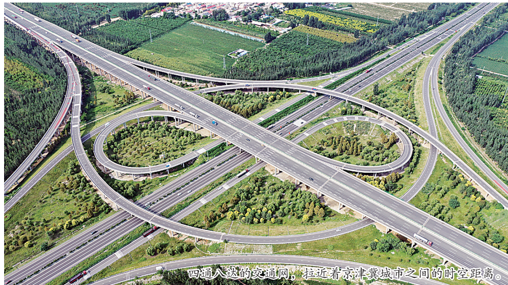
四通八达的交通网，拉近着京津冀城市之间的时空距离。