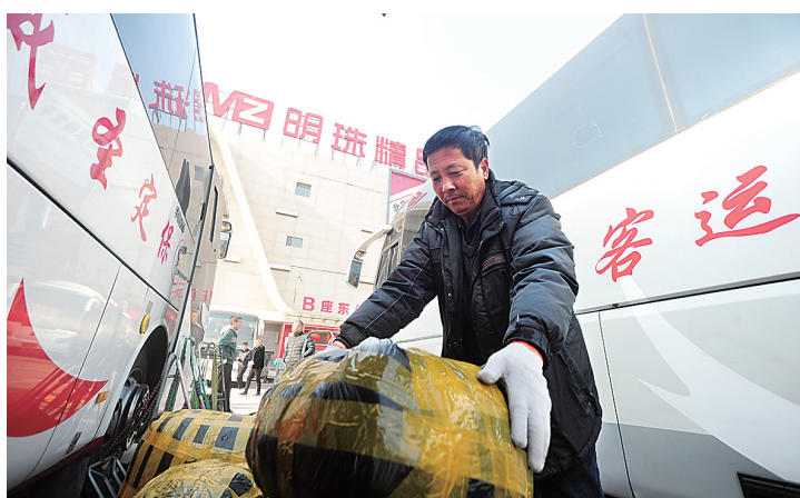
明珠商贸城和明珠国际服装生态新城，吸引了1.2万余户批发商户、600多家服装服饰加工生产企业转移入驻。