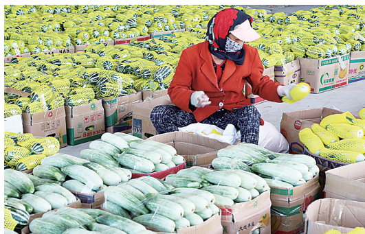
青县依托自身区位优势以及特色鲜明的蔬菜产业优势，积极打造京津市场“菜篮子”。