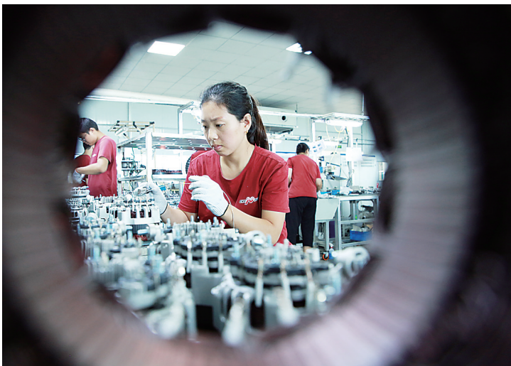
河间再制造产业示范基地是全国第四家、北方唯一一家获批的国家级再制造产业示范基地。