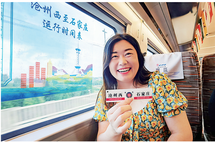
沧州至石家庄实现高铁直达。