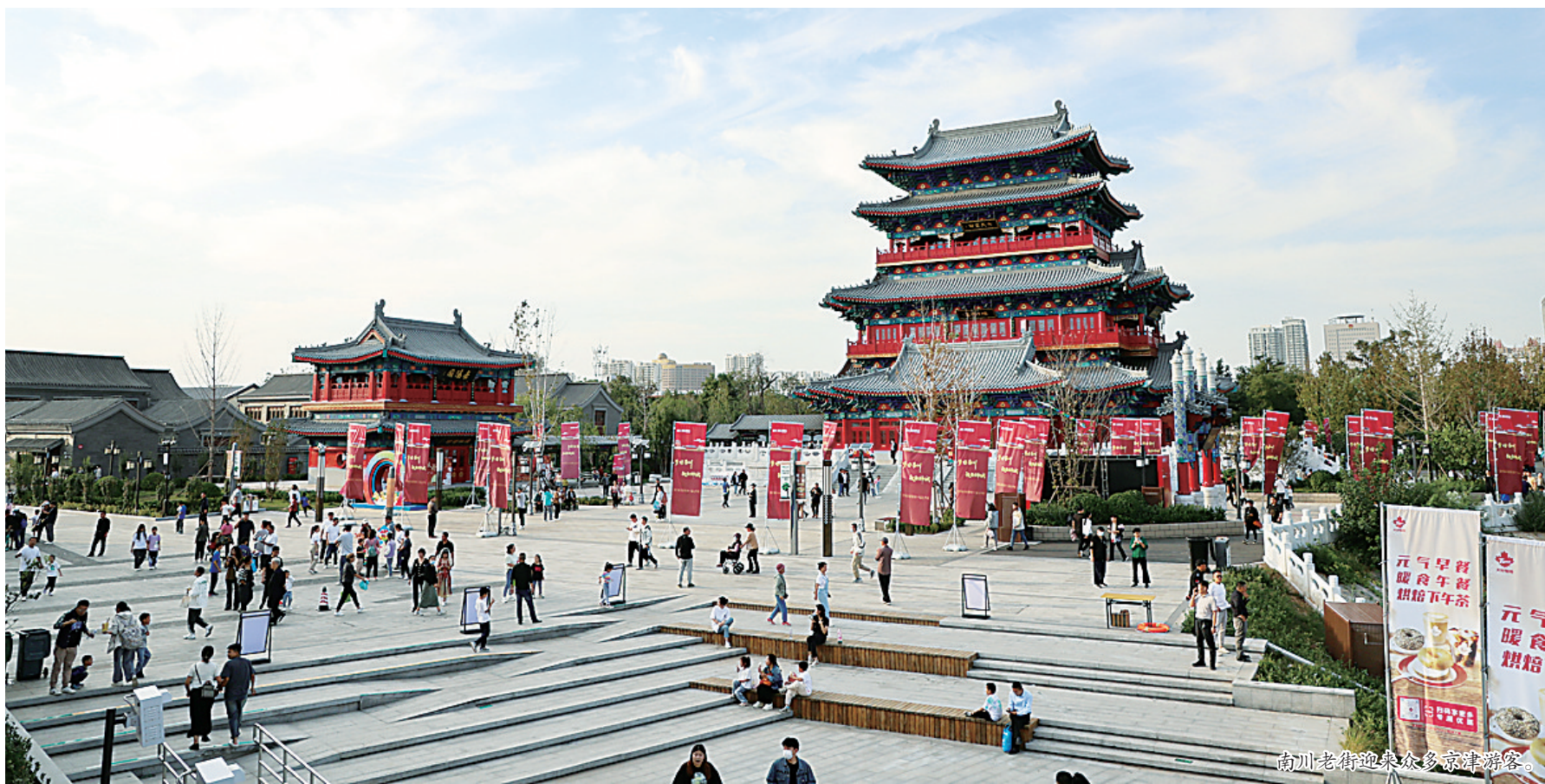
南川老街迎来众多京津冀游客。