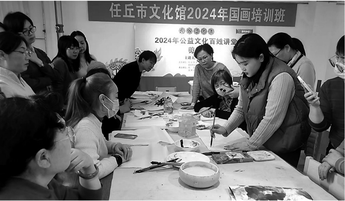
任丘公益文化百姓讲堂是任丘市文化馆自2012年创办的品牌活动之一,每年都会针对不同群体的不同需求开办各类课程。近年来,百姓讲堂依托新时代文明实践中心不断完善创新,由原来的“我讲什么你听什么”改进为“你想听什么我就讲什么”,并把百姓讲堂开到农村、社区,受到群众一致好评。图为学员在上国画培训班。