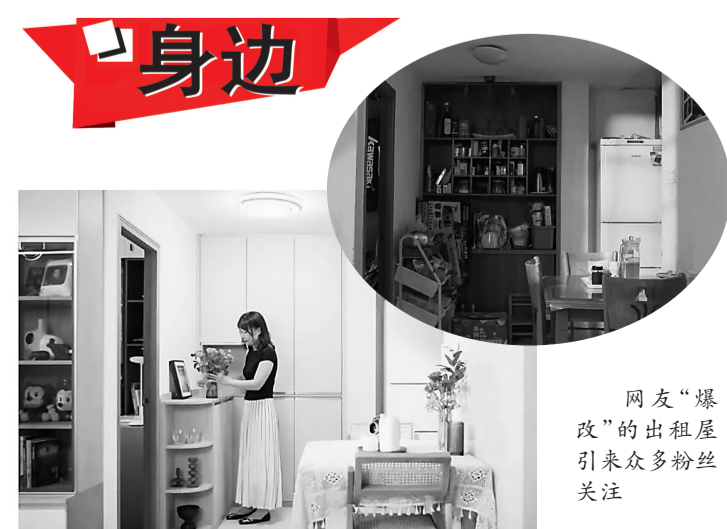
网友“爆改”的出租屋引来众多粉丝关注