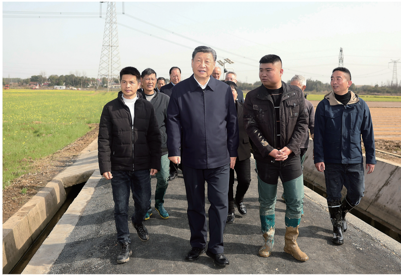
3月18日至21日，中共中央总书记、国家主席、中央军委主席习近平在湖南考察。这是19日下午，习近平在常德市鼎城区谢家铺镇港中坪村，同种粮大户、农技人员、基层干部亲切交流。

新华社长沙3月21日电 中共中央总书记、国家主席、中央军委主席习近平近日在湖南考察时强调，湖南要牢牢把握自身在构建新发展格局中的战略定位，坚持稳中求进工作总基调，坚持高质量发展不动摇，坚持改革创新、求真务实，在打造国家重要先进制造业高地、具有核心竞争力的科技创新高地、内陆地区改革开放高地上持续用力，在推动中部地区崛起和长江经济带发展中奋勇争先，奋力谱写中国式现代化湖南篇章。