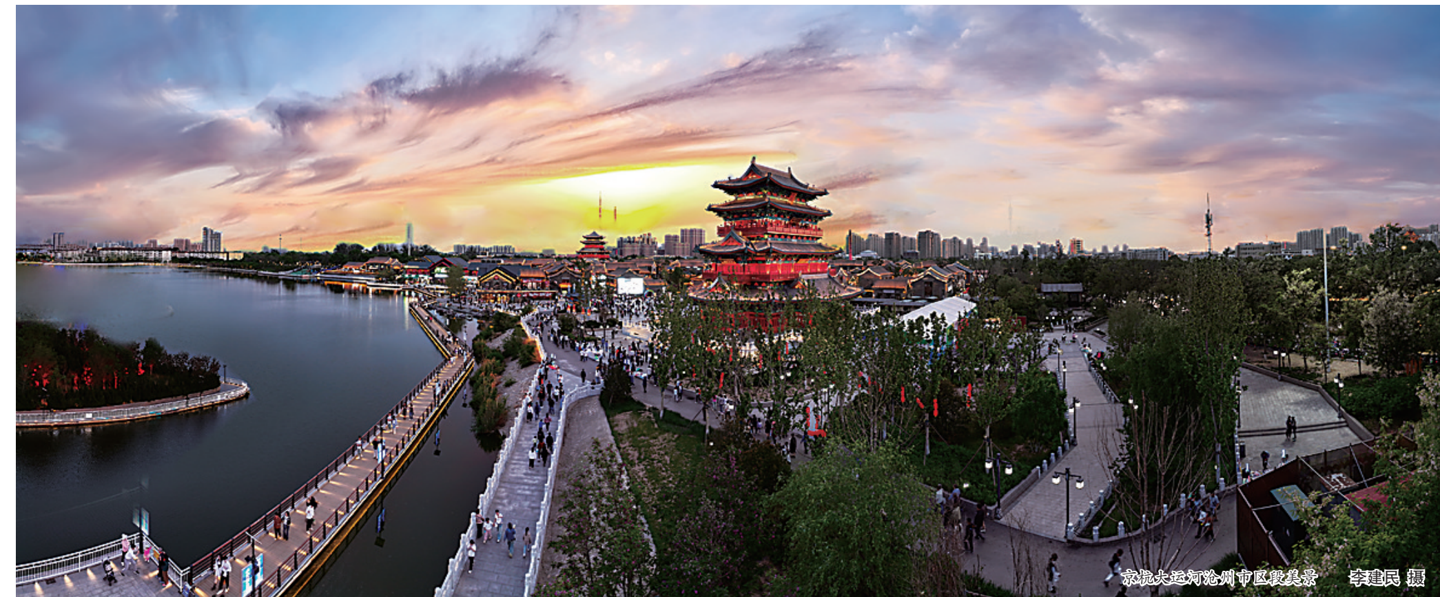
京杭大运河沧州市区最美景观