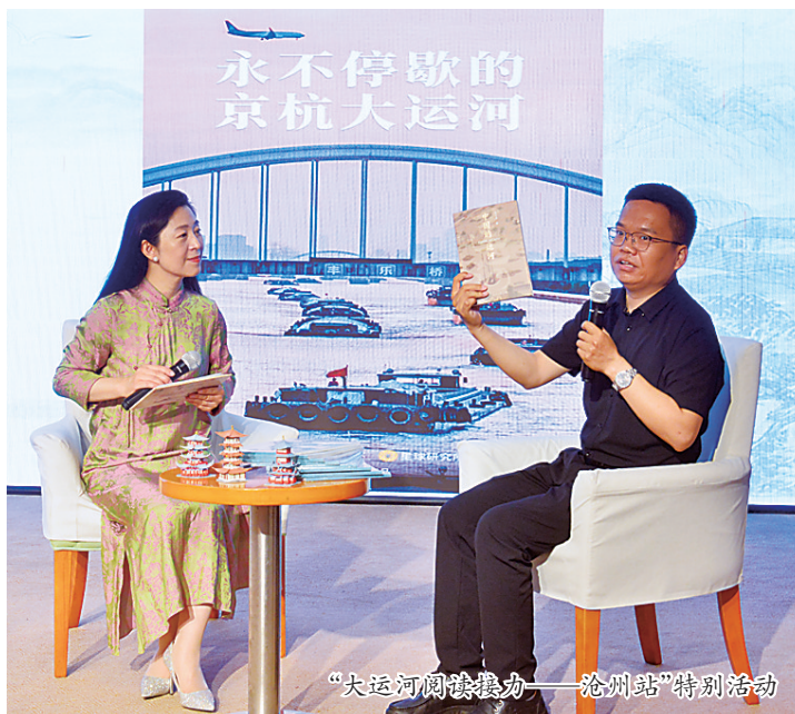
“大运河阅读接力——沧州站”特别活动