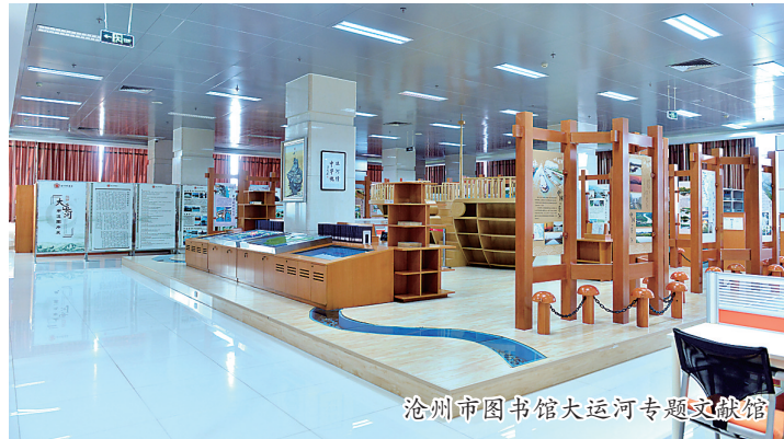
沧州市图书馆大运河专题文献馆