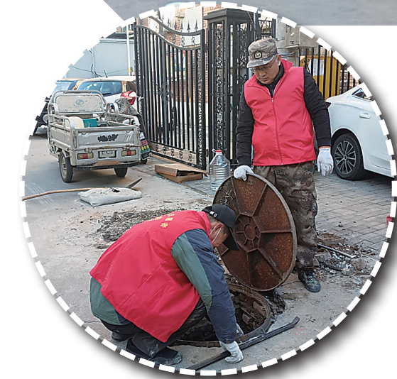
▲热心居民维修小区破损井盖