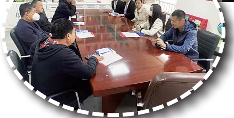
▲社区多方代表共同议事

近日，在运河区荣盛社区香堤荣府小区4号楼前，社区工作人员和物业公司负责人正在协商扩大电动自行车停放区域的事情。