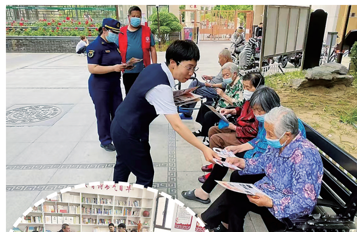
▲物业工作人员向居民宣传消防安全知识