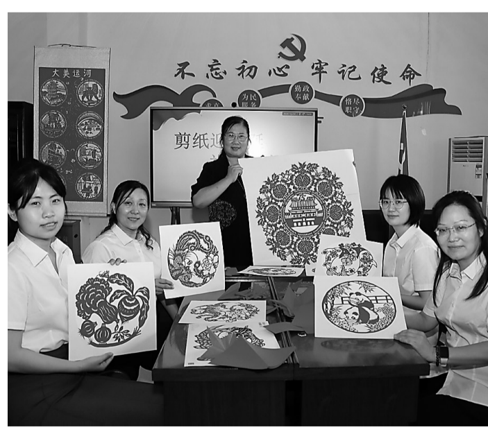
日前,盐山县烟草专卖局邀请剪纸老师为女职工讲解剪纸技艺,大家用一幅幅剪纸作品表达美好心愿,庆祝新中国成立75周年。

庄子村党支部书记姜权亭说,养殖户利用这种方式养出的咸水对虾不仅口感好、回味鲜,蛋白质、脂肪等营养物质的含量也很高。这几年,村里养殖的对虾上市,深受广大消费者喜爱。如今,随着当地村民养虾的经验越来越丰富,村“两委”牵头建起了孵化池和育苗场,计划打造“育繁推”一体化对虾养殖体系。截至目前,当地咸水对虾亩产量从2002年的不到20公斤,增长到现在50余公斤。“今年我们村有230户村民养殖对虾,对虾总产量能超50万公斤。”姜权亭介绍,对虾养殖解决了本村及周边村子3000多名村民的就业问题。