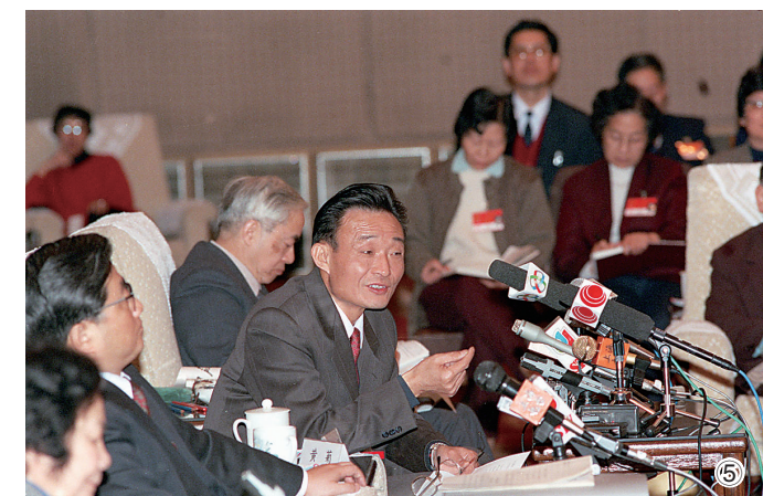
图⑤：1994年3月，时任上海市委书记的吴邦国同志在全国两会上海代表团全会上。

吴邦国同志是中国特色社会主义民主法治建设的重要领导者。他强调，如果没有比较完备的、高质量的法律法规，就谈不上实现社会主义民主政治的制度化、规范化和程序化，就谈不上依法治国、建设社会主义法治国家。在党中央领导下，他将立法工作作为全国人大及其常委会的首要任务，紧紧围绕党中央确定的立法工作目标，坚持科学立法、民主立法，适应社会主义市场经济发展、社会全面进步和加入世贸组织的新形势，把中国特色社会主义法律体系中基本的、急需的、条件成熟的法律作为立法重点，抓紧制定修改相关法律，集中开展法律清理工作。2003年3月，他担任中央宪法修改小组组长，在中央政治局常委会领导下主持宪法修改工作。由十届全国人大二次会议通过的宪法修正案，确立了“三个代表”重要思想在国家政治和社会生活中的指导地位，明确国家尊重和保障人权、依法保护公民的私有财产权和继承权等内容，对促进我国经济社会发展、推进中国特色社会主义民主法治建设具有重要意义。在他的主持下，第十、十一届全国人大及其常委会共审议通过宪法修正案草案、法律草案、法律解释草案和有关组织问题的决定草案186件，包括物权法、企业破产法、企业所得税法、公务员法、行政许可法、治安管理处罚法、劳动合同法、未成年人保护法、妇女权益保障法、关于加强网络信息保护的決定等。在党中央领导下，他主持制定反分裂国家法，把党和国家对台工作的大政方针和政策措施以法律形式固定下来，为反对和遏制“台独”分裂活动、促进祖国和平统一提供有力法律保障。他主持对香港特别行政区基本法、澳门特别行政区基本法及其附件有关条款作出解释并通过相关决定，推动两个基本法正确实施和“一国两制”方针贯彻落实。他主持制定修改一系列对中国特色社会主义事业发展具有重大影响的法律，为推动形成中国特色社会主义法律体系作出重要贡献。（下转第五版）