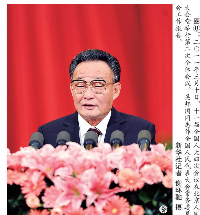
图⑧：二〇一一年三月十日，十一届全国人大四次会议在北京人民大会堂举行第二次全体会议。吴邦国同志作全国人大常委会工作报告。