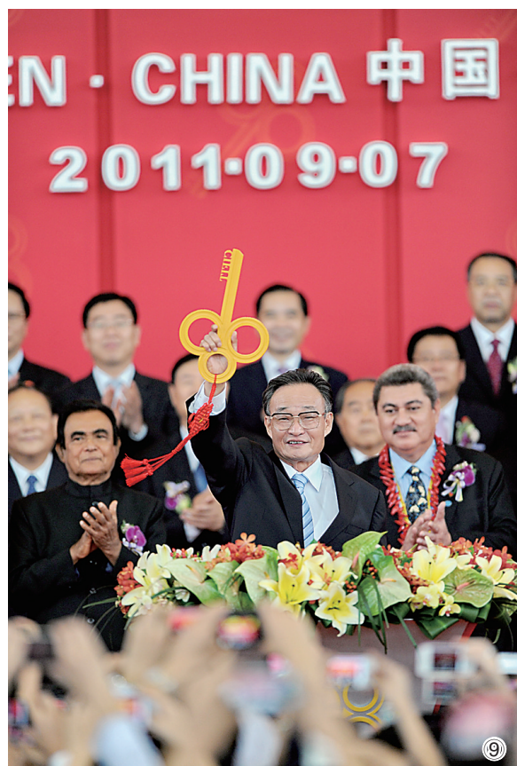
图⑨：二〇一一年九月七日，吴邦国同志在福建厦门出席第十五届中国国际投资贸易洽谈会开幕式。