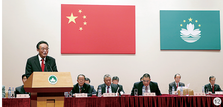
图⑫：2013年2月21日，吴邦国同志在澳门文化中心出席澳门社会各界纪念澳门基本法颁布20周年启动大会并发表讲话。