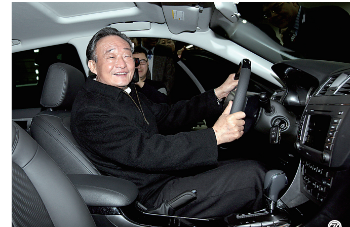
图⑦：2010年1月30日，吴邦国同志在上海汽车集团股份有限公司技术中心察看新能源样车。