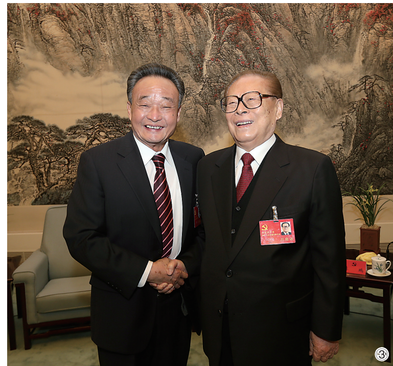
图③：2012年11月14日，中国共产党第十八次全国代表大会在北京闭幕。这是闭幕会前，江泽民同志与吴邦国同志在一起。