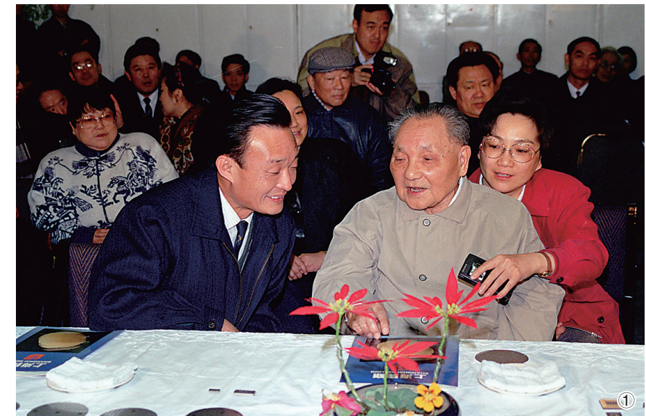
图①：1992年2月10日，邓小平同志在上海贝岭微电子制造有限公司参观时与吴邦国同志交谈。