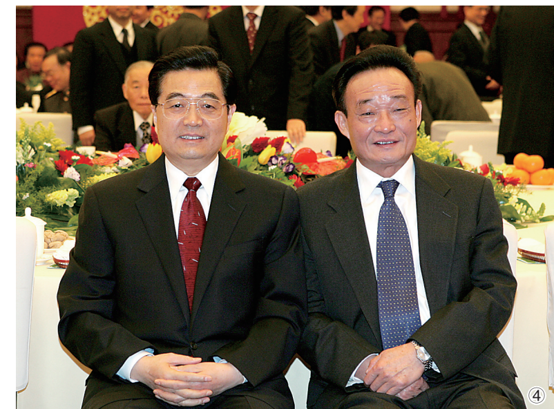
图④：二〇〇五年一月一日，全国政协在北京举行新年茶话会。这是胡锦涛同志与吴邦国同志在一起。