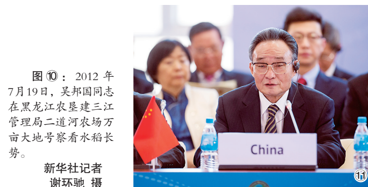
图⑪：2013年1月28日，吴邦国同志在俄罗斯符拉迪沃斯托克出席亚太经合组织第21届年会，并作题为《坚持和平发展 促进合作共赢》的主旨发言。