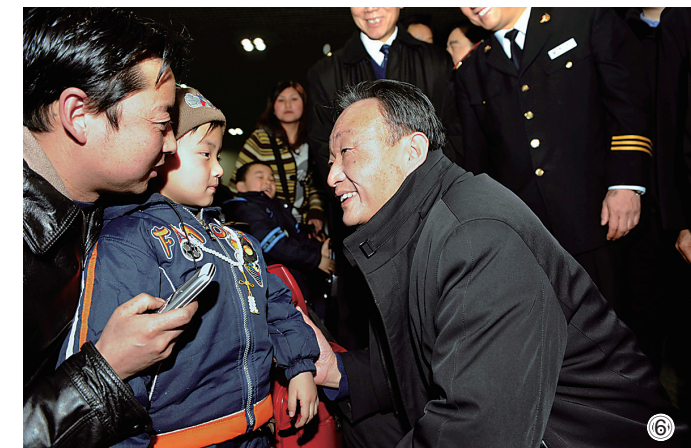
图⑥：2008年2月3日，吴邦国同志在北京西站候车室与旅客交谈。