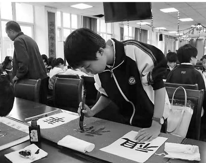
日前,沧县杜林镇中心校举办“国防知识竞赛暨书、画、手工创作”活动,杜林镇各中小学的100余名选手参赛。

晒场;对农村公路沿线的砂、石等建材市场、废旧回收点等有碍观瞻的经营场所进行迁移或遮挡;在建筑控制区内,彻底清理柴草堆、垃圾堆和其他堆积物;路面平整、边沟、路肩较为完好的道路进一步整修;路面存在病害的进行小修和中修,路面破损严重、影响车辆通行且中小修无法满足的,向县级政府申请进行大修或改建;农村公路沿线不宜植树路段全部补种低矮灌木或花草,并确保绿化成活率不低于90%。同时,在农村公路桥梁上游500米、下游1000米范围内,重点治理取土倾倒废弃物等行为,对已倾倒的废弃物彻底清理,对因取土形成的可能危害农村公路桥梁安全的河床进行全面恢复等。