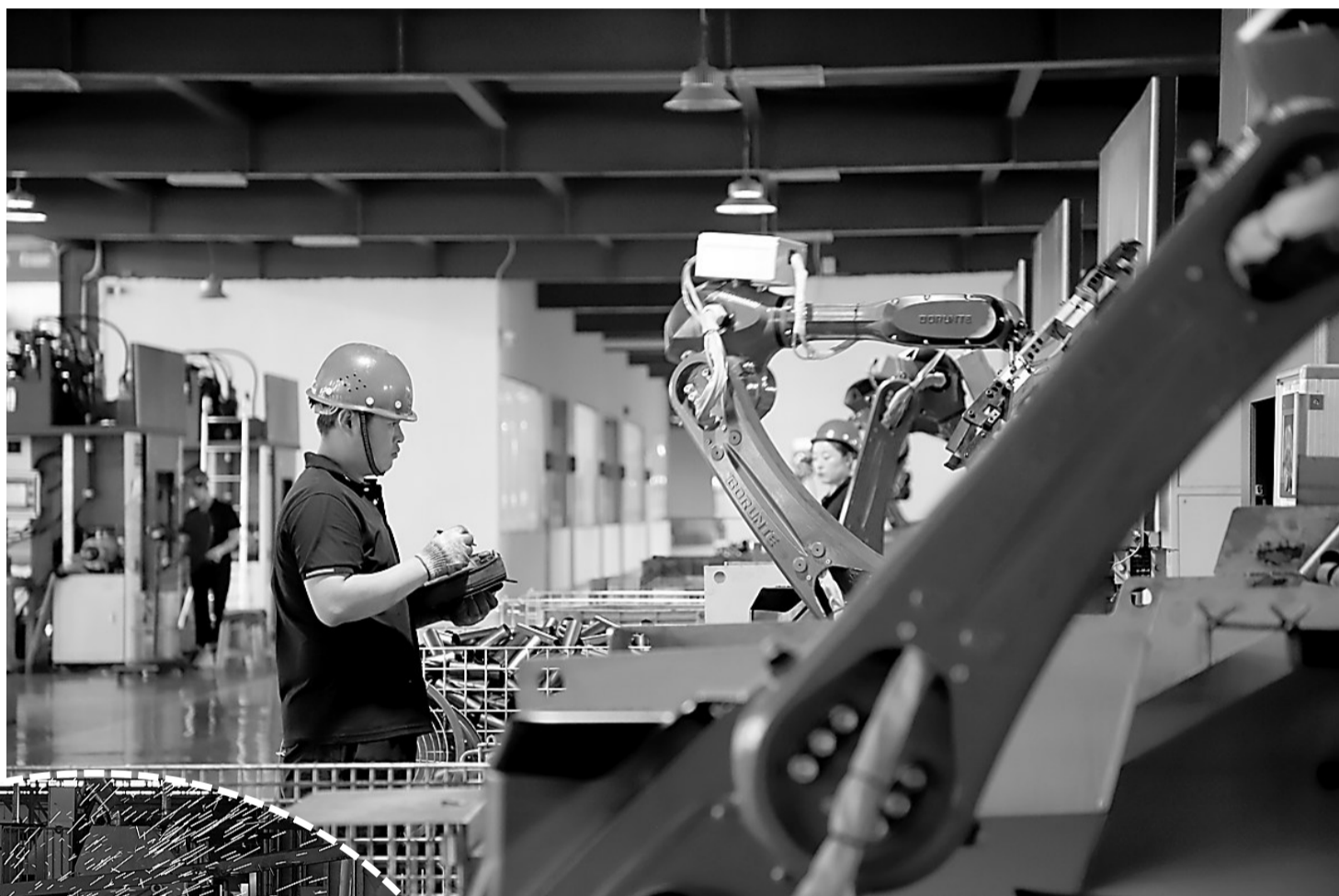
▲河北龙锦管道装备有限公司生产车间内,工人正在调试水涨成型机器人。