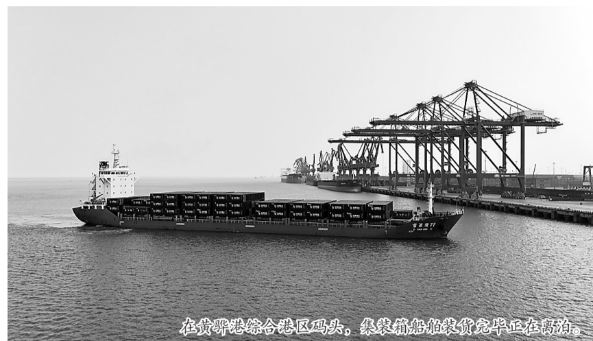
在黄骅港综合港区码头,集装箱船装卸完毕正在启航。

据介绍,接下来,沧州港务集团将持续推进总投资558亿元的集装箱、滚装、原油、LNG等21个码头项目建设,实施综合港区、散货港区20万吨级航道改造提升,加快集疏港铁路专用线等集疏运体系建设,打通铁路进港“最后一公里”,增强货物接卸运输能力,加快落实沧州港口型国家物流枢纽建设,充分发挥黄骅港陆海联运主通道作用,完善港口物流、贸易等功能,推动黄骅港转型升级,全力打造多功能、综合性、现代化大港。