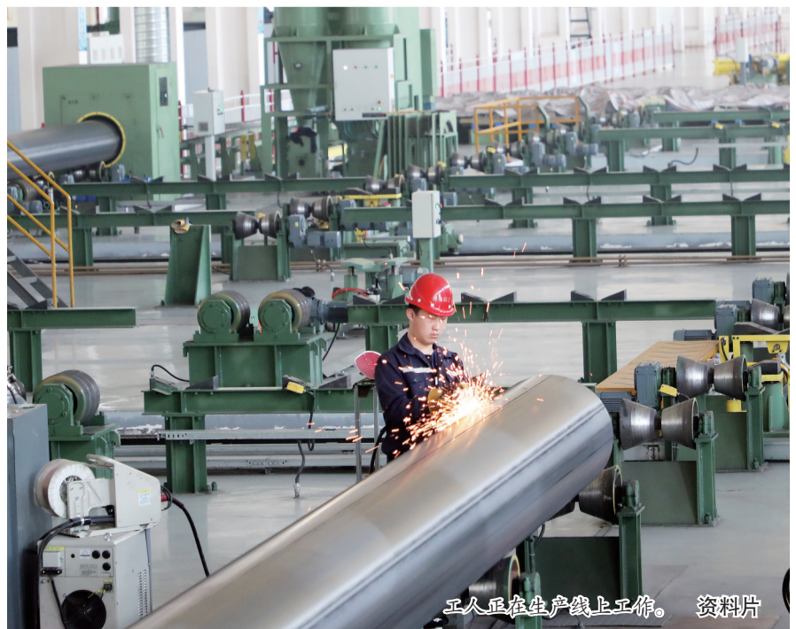
工人在生产线上工作。资料片

今天，2024中国（沧州）管道装备展览会拉开帷幕，来自全国各地的200余家上下游企业相聚沧州，展示管道装备产业的新成果、新技术，为管道装备产业做优产业链、做强品牌释放高质量发展新动能。