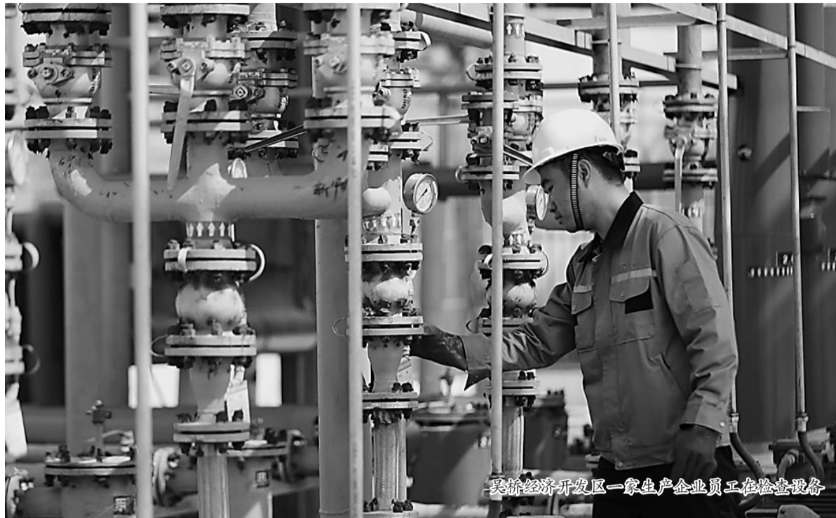
吴桥经济开发区一家生产企业员工在检查设备

聚焦重点,落实为要。全县各乡镇、各部门抓牢抓实项目建设,做好项目协调、指导、服务、推进等工作,专题研究项目建设过程中