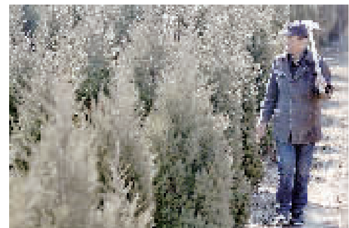
一位村民正察看塔松长势。