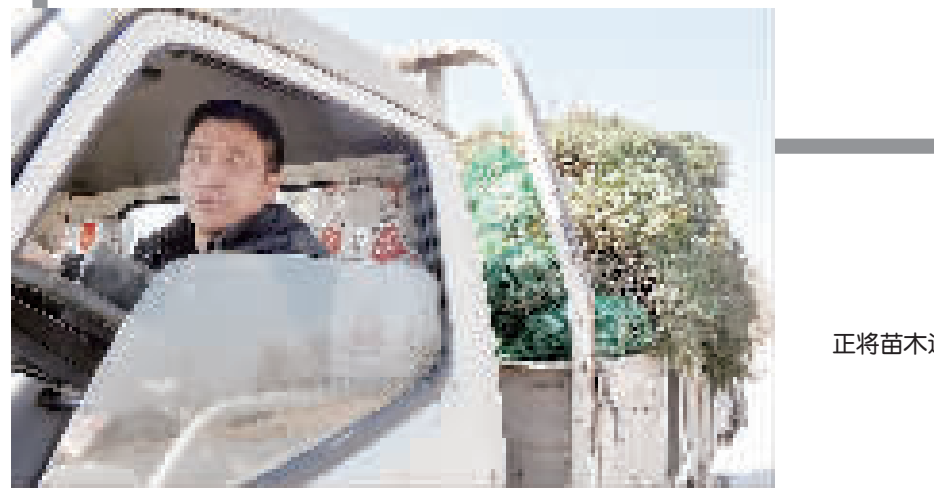
正将苗木运往外地。