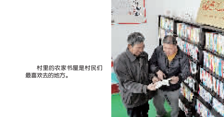
村里的农家书屋是村民们最喜欢的地方。