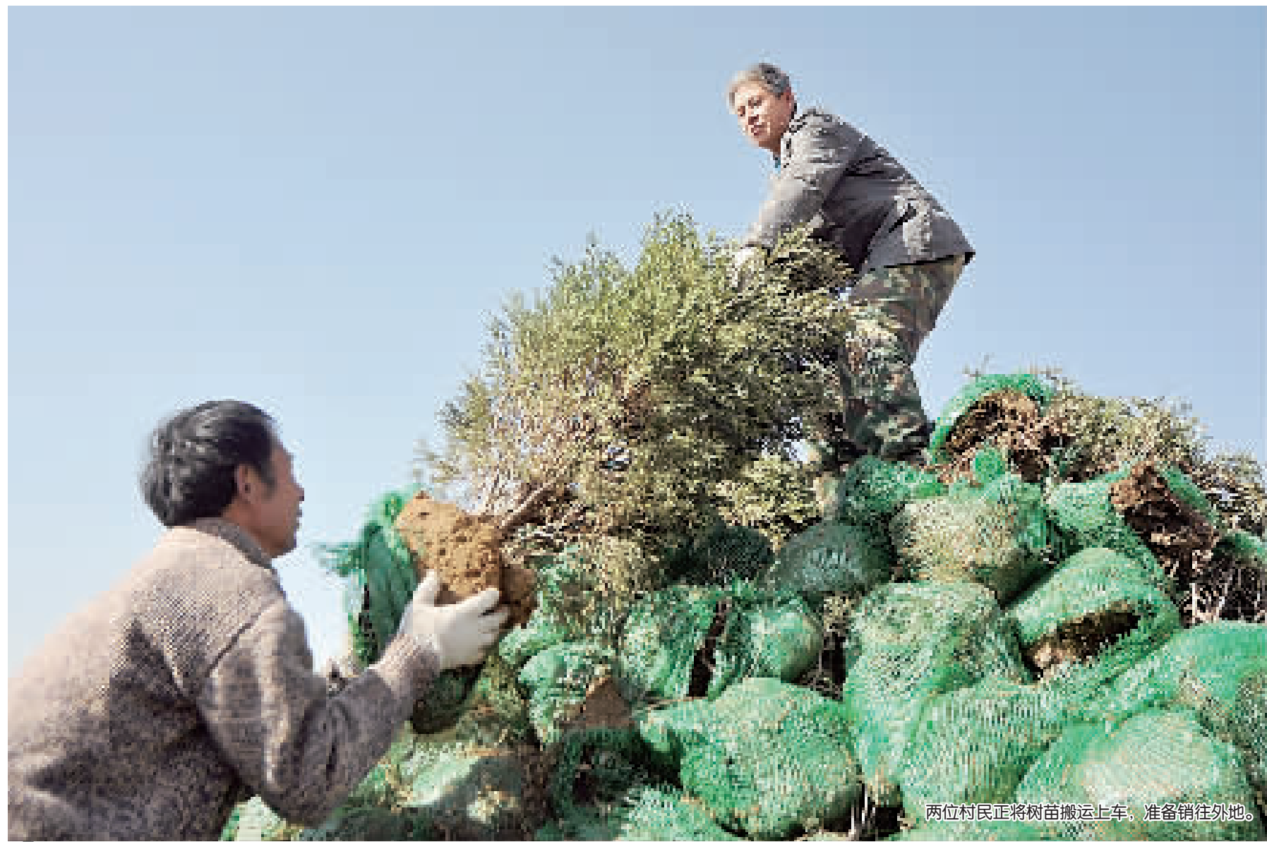
两位村民正将树苗搬上卡车，准备销往外地。

又到全民植树时节，随着全社会植树造林的意识不断加强，在青县，近年也发展起来一个苗木销售专业村，村民还依靠此“绿色”产业逐渐走上致富之路——