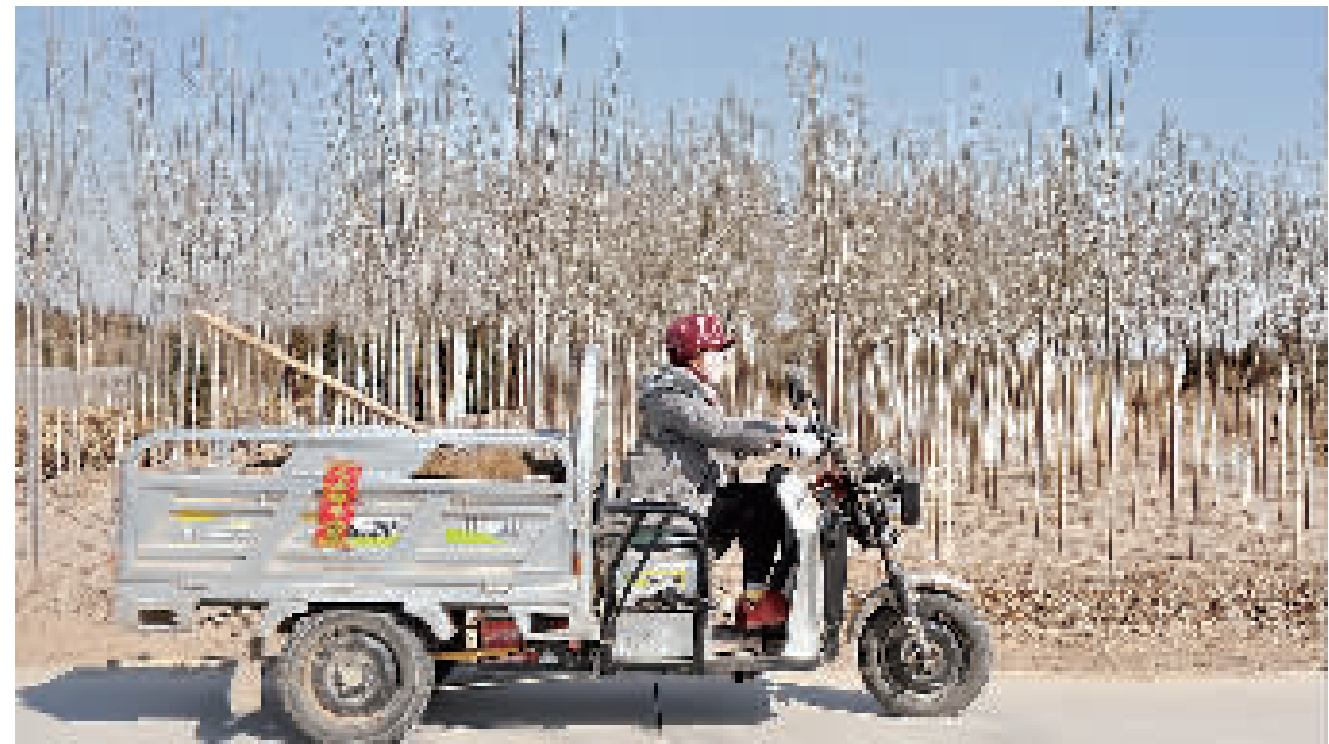
一位村民正骑着电三轮车从一片杨树苗地经过。