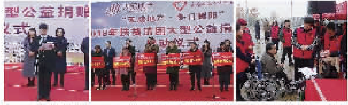
天成地产扶贫济困大型公益捐赠活动启动仪式

寒门出贵子，天成地产助力。在党和政府的关怀下，在企业的支持下，不同背景的寒门学子在阳光下茁壮成长，成为国家栋梁之才，成为国家和民族的骄傲。