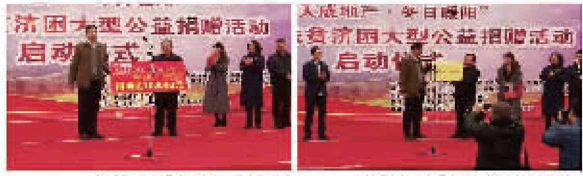
天成地产扶贫济困大型公益捐赠活动启动仪式

此次公益捐赠，天成地产针对沧州地区建档立卡贫困户和贫困学生进行定向帮扶。包括2018年初入学的大学生家庭10户，每户资助学费3000元；上学期间的贫困高中生家庭30户，每户资助生活费1000元；贫困初中生家庭100户，每户资助生活费500元。