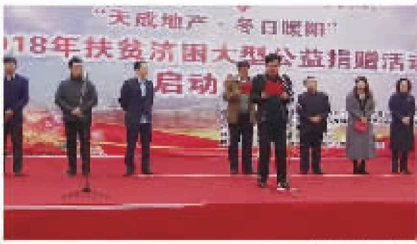
天成地产扶贫济困大型公益捐赠活动启动仪式

“老吾老以及人之老，幼吾幼以及人之幼”，是中国文化基因中传承千年的美德，也是“大同天下”的终极理想的一种现实反映。而在当代社会，就是国家所倡导的由先富阶层通过传帮带，带动贫困阶层摆脱贫困，共同致富。