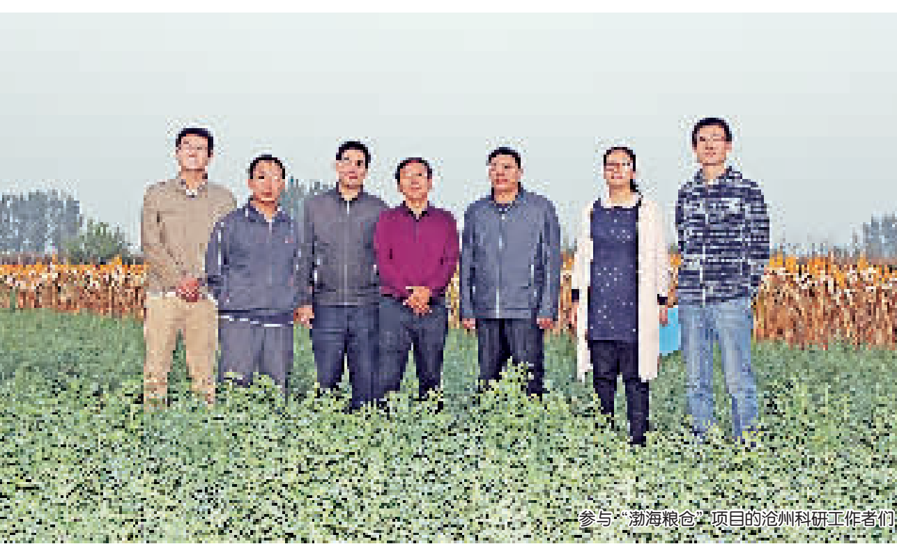
参与“渤海粮仓”项目的沧州科研工作者们。

渤海粮仓是我国一项巨大的农业科技工程,涉及110多万平方公里土地和2亿人口,通过对环渤海地区中低产田和盐碱地的改造,将长期遭受旱涝咸灾的环渤海地区,建成我国重要的粮仓。