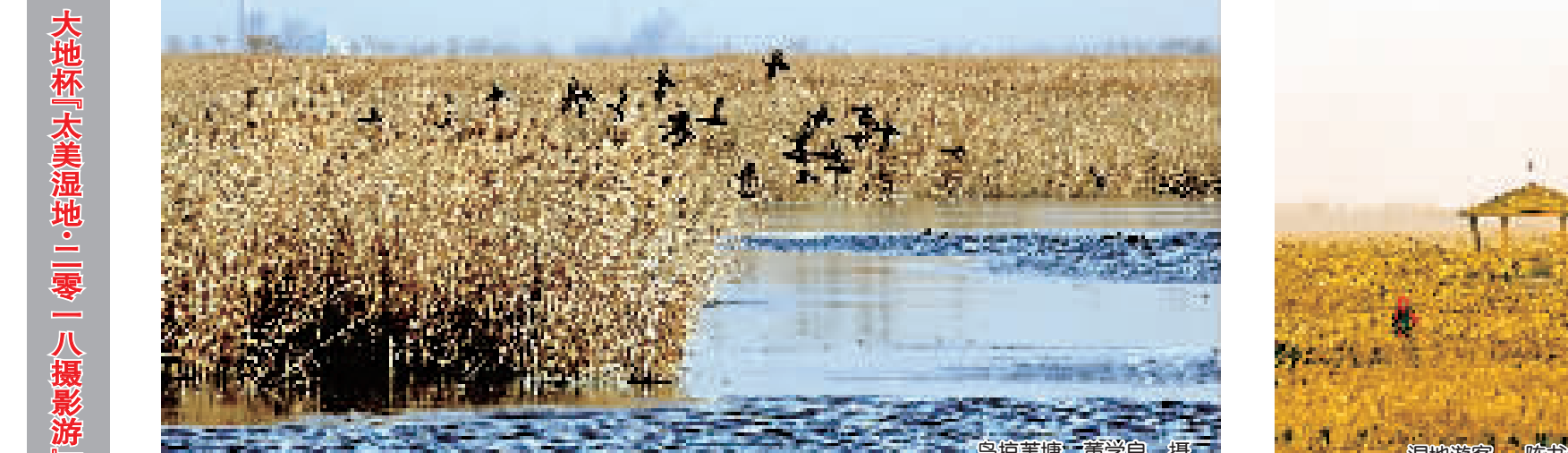
晨曦晨曦

李平安要寻找的战友叫范福祥。他们同是1965年入伍,同属中国人民解放军工程建设某部252团二营九连八班。当年部队在皖南山区打坑道,当时部队开展“一帮一、一对红”活动,他俩因沧州老乡,自然而然地结成了互助对子。平时谁有个头疼脑热的,就互相照应着。范福祥不太爱说话,但对人很真诚,让李平安感受到了浓浓的战友情。 共处两年多后,李平安调到七连当班长,从两人就再也没有见过面。1984年,李平安调回沧州当连长,曾多次打听战友的下落,都无果。越上年,越想越念战友,于是给战友打来了求助电话。 寻找战友的消息刊登在当日的《沧州晚报》的亲友栏看到了,然后他和李平安取得了联系,两人聊了很久,原来范福祥是运河区小字一号,1974年复员后,去了大港油田工作,后又调到北油田,现常任主任。电话里,二人把当年的战友一一说了一遍,更让人高兴的是,还有另外两位老战友的到报纸后,也与李平安取得了联系,大家回忆着军营生活的点滴,仿佛又回到了激情燃烧一身戎装的岁月。