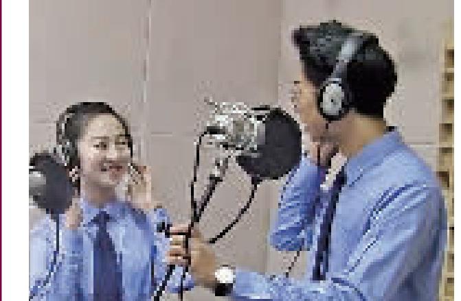
“穿上这身藏蓝,扛起肩上重担,日复一日年复一年,冷风寒意凛冽,身影穿梭大街小巷,一日三餐无常,帮扶群众送去温暖……”近日,由市公安局巡警支队四队全体人员自编自导自拍的《我们为你守关》爆红微信朋友圈,短短几天浏览量超过3000次,不少网友直呼好看。