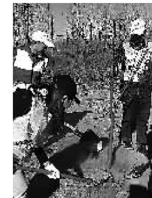
近日,献县红十字会30余名志愿者来到献县城南献王路南段,在第三片红十字志愿者“公益林”中植树550余株。

3月9日下午,新华区欣怡小区热心人李玉智来到欣怡社区。他说,路边摆摊的邻居在东风路上捡到一个钱包,等了一会儿也不见有人来找,便把钱包交给了他。